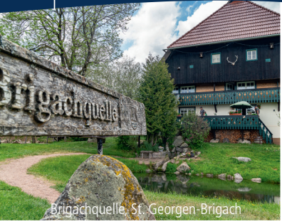
Brigachquelle, St. Georgen-Brigach