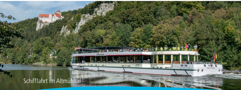
Schiffahrt im Altmühltal

Start: Wöhrdplatz, Kelheim – Schiffsanlegestelle 93309 Kelheim/Donau ÖPNV: Bushaltestelle Wöhrdplatz/Kelheim PKW: Volksfestplatz Kelheim, Am Pflegerspitz, 93309 Kelheim