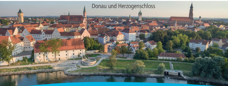
Donau und Herzogenschloss

Start: Staustufe Straubing ÖPNV: Bahnhof Straubing PKW: Oberauer Straße, 94315 Straubing